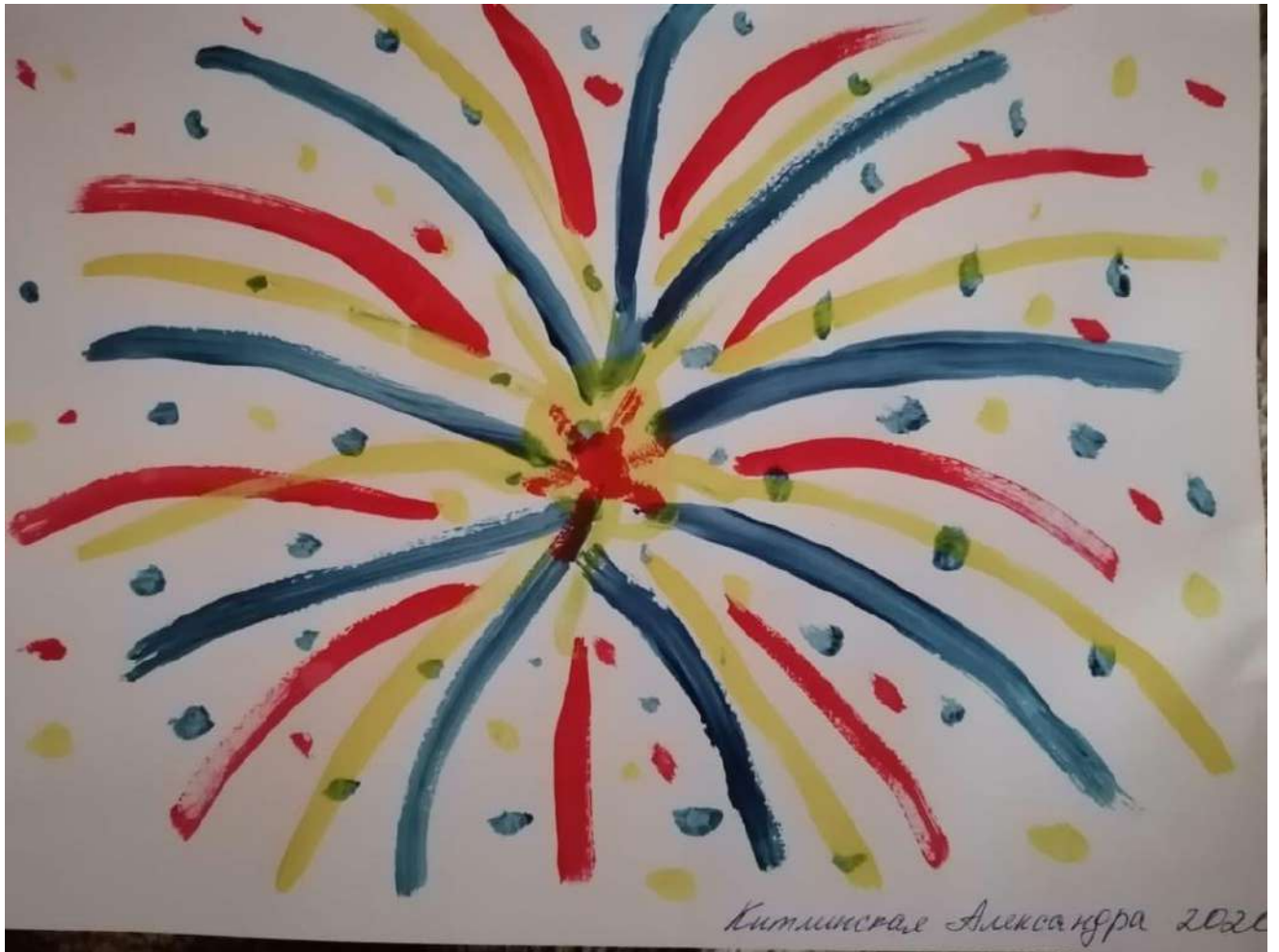
«Салют из окошка моего дома»