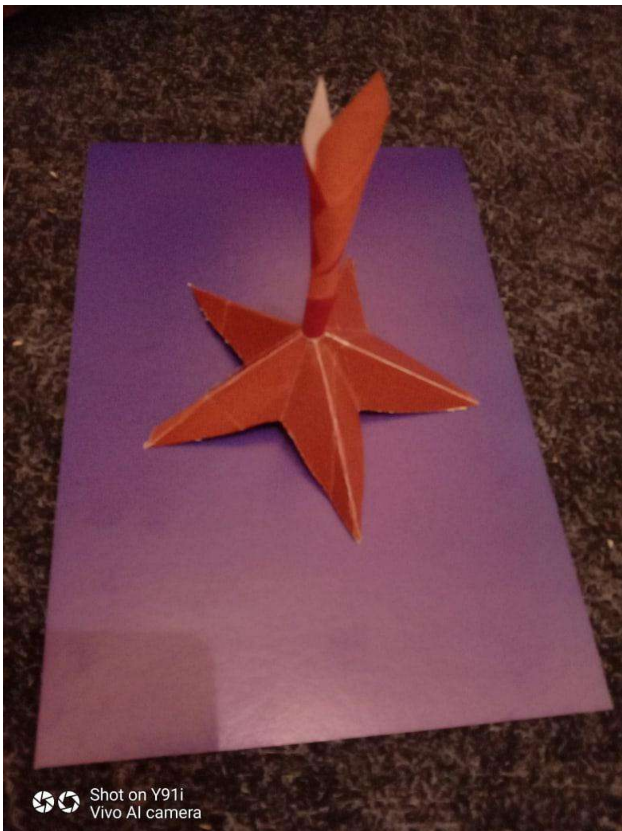
поделка к Дню Победы