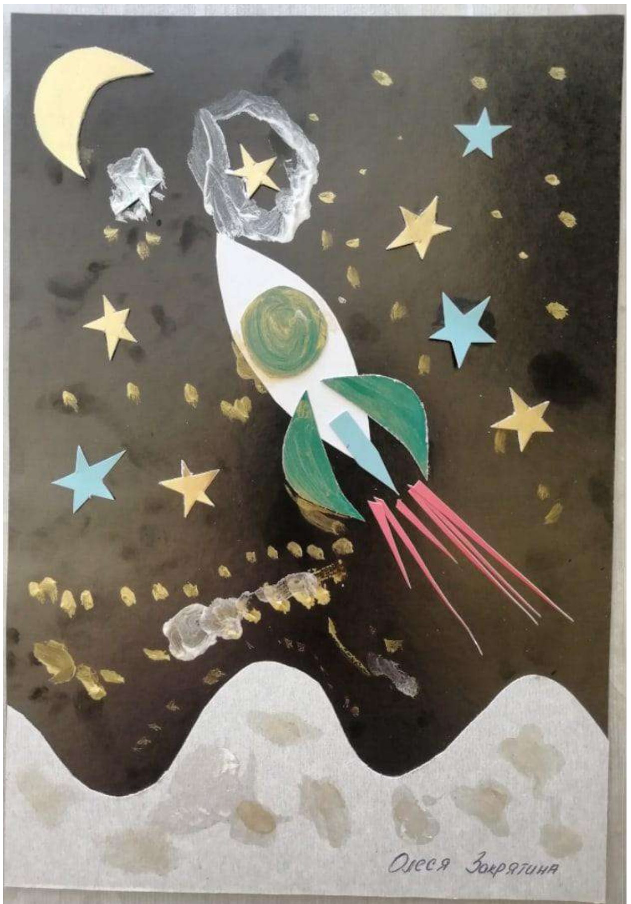
поделка к Дню Космонавтики